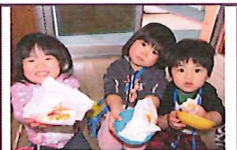
しろくみさんが作ってくれたクレープです!

～入園・進級おめでとうございます！ 1年間、先生やおともだちと仲良く元気に遊びましょー!!～